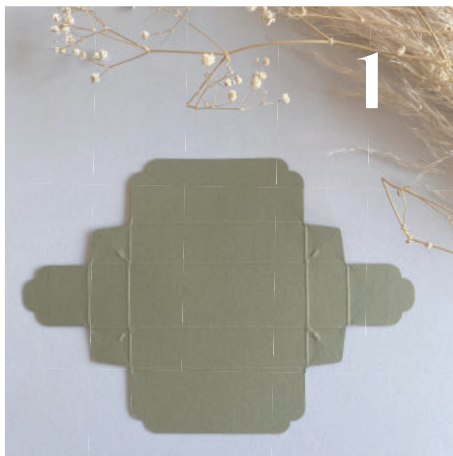
1 Bodem vouwen: Leg de bodem met de binnenzijde naar boven

Deze schuifdoosjes bestaan uit 2 delen: de bodem (in karton) en de sleeve (in transparante mica of kalkpapier)