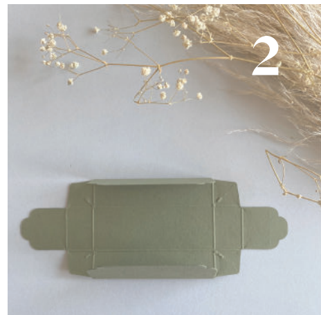
2 Vouw de buitenste flappen naar binnen