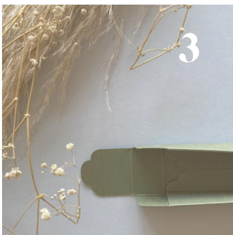
3 Vouw de middelste flappen naar binnen